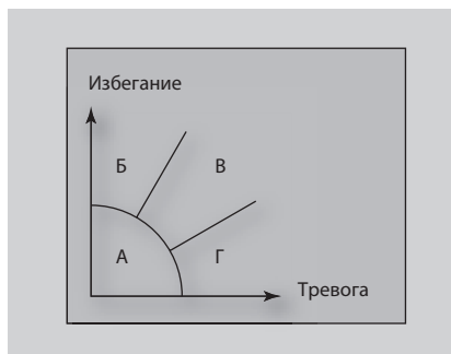
Рис. 1. Современная модель типов привязанности взрослых.

Хотя проведено множество исследований, подтверждающих влияние качества эмоциональной связи с близким взрослым в детстве на формирование индивидуально-личностных, коммуникативных и познавательных особенностей человека, значение привязанности на разных возрастных этапах становления личности раскрыто еще далеко не полностью (Бурменская, 2011). Это относится к такой важной подсистеме семьи, как взаимоотношения между сиблингами.