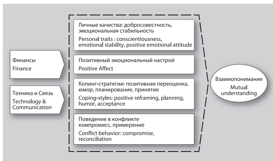
Рис. 3. Внешние и внутренние факторы взаимопонимания родителей и детей в период карантина COVID-19