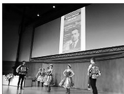
Открытие III Международной конференции, посвященной Л.С. Выготскому

Далее докладчик показал, как ставится и решается эта проблема в рамках одного из направлений, которое вошло в «золотой фонд» мировой психологической науки, породив (и продолжая порождать) острее споры как по пово-