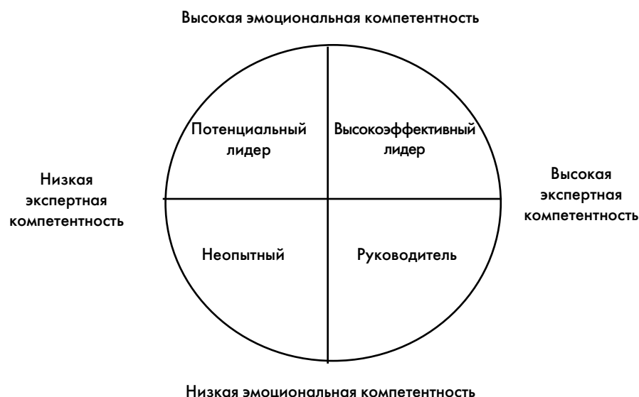
Рисунок 1. Стадии развития лидера

Реализация второй стратегии, связанной с развитием лидерского потенциала сотрудников организации, не в последнюю очередь актуализируется в связи с демографической ситуацией в стране: снижение рождаемости и увеличение доли пожилых людей в составе населения [6]. Многие компании, сталкиваясь с проблемой дефицита кадров, начинают осознавать, что человеческий