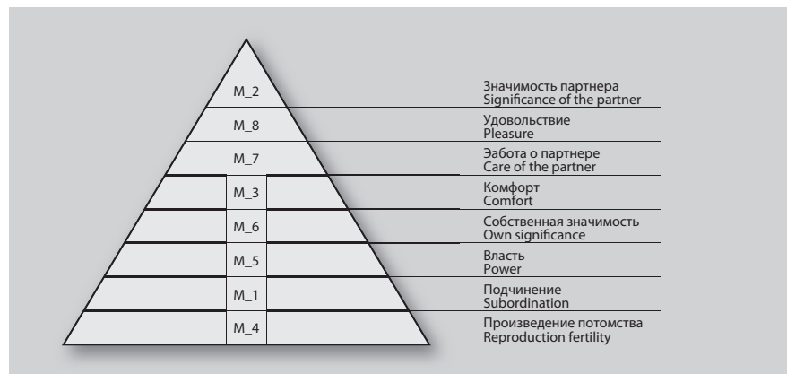
Рис. 1. Иерархия сексуальных диспозиционных мотивов

Возможно, это связано также с более сильными переживаниями женщин по поводу угрозы разрыва отношений, опасениями утраты партнера. Отсюда всяческое подчеркивание в сексуальных отношениях силы, власти и значимости партнера. Вполне вероятно, что таким образом, бессознательно или косвенно женщины манифестируют свои ожидания по поводу поведения мужчины в других сферах отношений, помимо сексуальных.