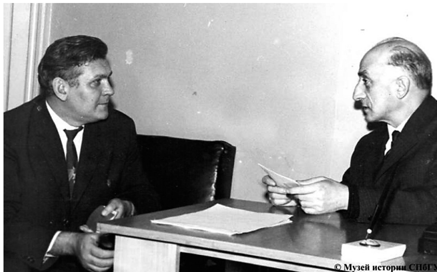
Б.Ф. Ломов и Б.Г. Ананьев

Наконец, настала оттепель. Еще полны сил вожди психологии и их соратники. В науку приходят новые люди – первые выпускники психологических отделений вузов. Это ведет к прорыву