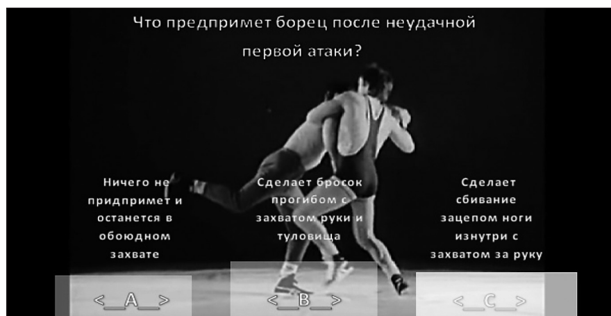
Рисунок 1. Момент остановки видеоролика. Ситуация выбора правильного ответа.

Для выявления психофизиологических механизмов антиципации, проводился анализ энцефалограмм, в ходе которого выявлялась динамика изменений активности мозга в период с первого по третий контрольные тренинги по каждому испытуемому. Был проведен спектральный анализ каждой записи на участках «остановка видеоролика – зрительная фиксация на ответе» (рис. 1.)